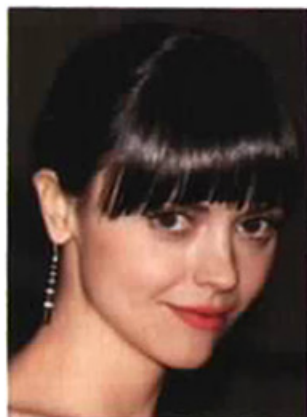
Christina Ricci: Vom kühlen, zarten Schneewittchen ...