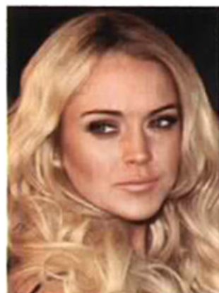
... zur „Queen of Sex-Appeal“ mit wilder, hellblonder XL-Mähne