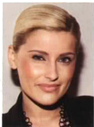
... zur eleganten Lady mit „Sleek Hair“ und Scheitel