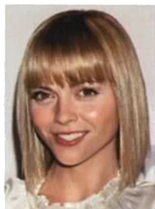
... zur fröhlichen Romantikerin mit angesagtem Bob