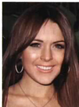
Lindsay Lohan: Vom natürlichen „All American Girl“ ...