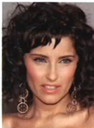
Nelly Furtado: Von der rassig gelockten Latina ...